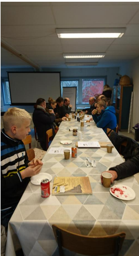
Stemningsbilleder fra oxalsyredrypning den 28. december.

Der var 40-50 medlemmer, og vi havde en rigtig hyggelig eftermiddag. Det var også dejligt at se, at alle vores bifamilier har overlevet frem til årsskiftet. Det lover godt for det nye år.