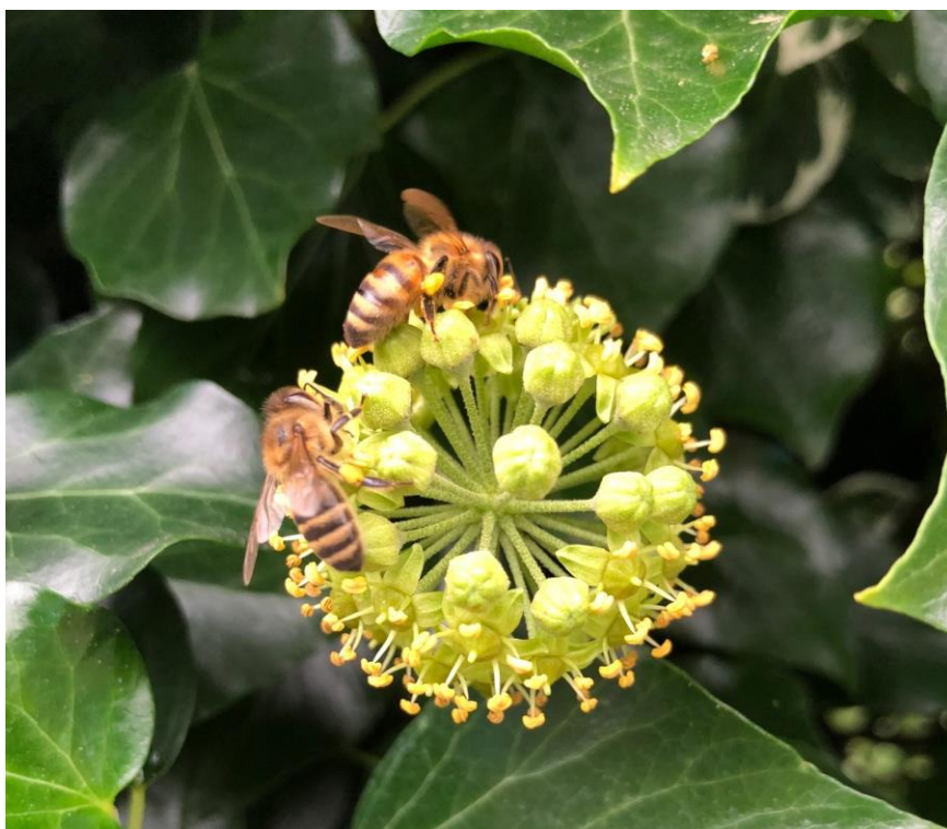
Lidt af den sidste pollen og nektar i år hentes fra vedbend

Lørdag den 2. januar 2021 kl. 14 Oxalsyre drypning af bier i skolebigården.